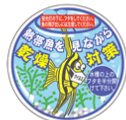
Tropical Fish B