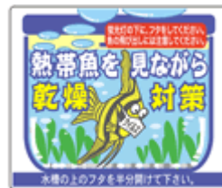
Tropical Fish A